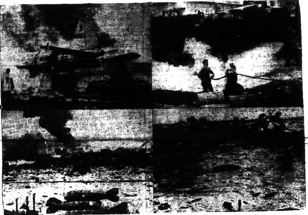
Các quang cảnh về vụ nổ tại phi trường Biên Hòa

SAIGON (UPI). - Hôm 17-5, Đại sứ Hoa Kỳ MacArthur D. Taylor tuyên bố rằng không có giới hạn về số các binh sĩ của Đại sứ Hoa Kỳ được đưa sang Miền Nam Việt Nam. Ông nói thêm rằng: "Tôi nghĩ rằng việc này là một bước tiến quan trọng trong việc giải quyết vấn đề của Việt Nam."