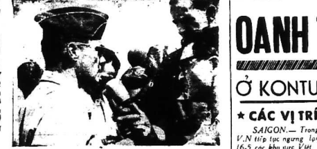
Hồi 15 giờ 30 ngày 16-5-65 Trung Tướng Moore nói cuộc họp báo tại phi trường Biên Hòa để nói về vụ nổ.