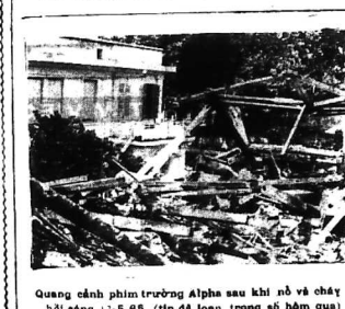
Quang cảnh phim trường Alpha sau khi nổ và cháy hồi sáng 12-5-65 (tín đã loan trong số hôm qua)

SAIGON - Hôm 17 giờ ngày 12-5-65 một cuộc tiếp tân trọng thể đã được tổ chức tại sân bay Tân Sơn Nhứt để chào mừng Lữ Đoàn Nhảy dù Mỹ.