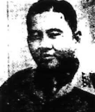
Đại tướng Dương Văn Minh

SAIGON - Chiều thứ Tư (12-5) chiếc phi cơ chở Đại tướng Dương Văn Minh đã hạ cánh tại sân bay Tân Sơn Nhứt.