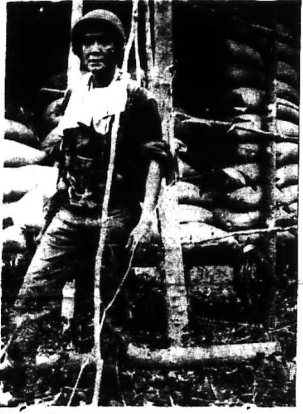
Kho gạo VC mà quân đội vừa khám phá được ở chiến khu Đương minh Châu