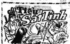
Do TỬ-KHÁNH-PHUNG phỏng dịch