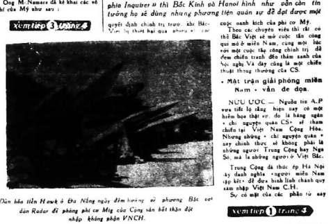
Dàn bài tiến hành ở Bộ Nội vụ để hướng dẫn phương Bắc về các Radar để phóng phi cơ Mig của Cộng sản tới biên giới không phận VNCH.

«Cố quyền» gọi binh sĩ vào Nam HƯƠNG CẢNG.— Theo sự thiết lập của Bộ Phái đoàn Liên lạc Việt Bắc Kinh ở Hanoi, nhiều cán bộ tin tưởng họ sẽ đang hướng phương tiện quân sự để đạt được một quyết định chính trị trong thời gian gần đây.