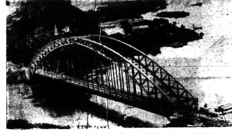
Các Hầm Răng ở Thành Hòa (địa điểm nổi lên Bắc và Trung Việt) của phi cơ Mig đánh phá.

• Một phi cơ F100 bị rơi nhưng viên phi công thoát nạn • Không có phi cơ Mig (CS) bay lên trong trận này