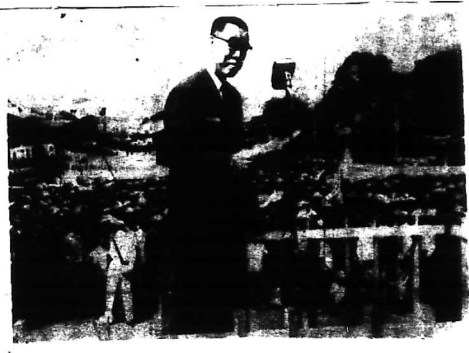
Ông Tổng Trưởng Bộ Nội Vụ Nguyễn Văn Hiệp đang Phát biểu cảm tưởng trước một rừng người ở Long Xuyên