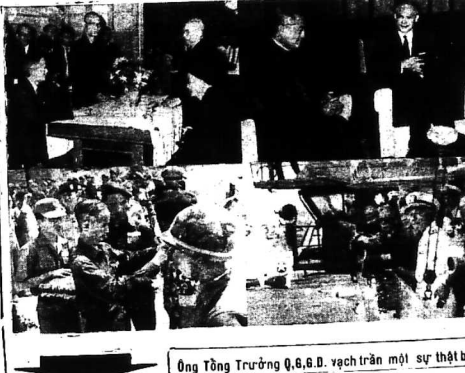
Ông Tổng Trưởng Q.B.D. vạch trần một sự thật bị giấu

PHÓNG PHÁO PHẢN LỰC CƠ ĐÀ THI HÀNH 20 PHỤ XUẤT ANH KỊCH CÁC VỊ TRÍ VIỆT CÔNG TÁC CÁC TỈNH KONTUM, PHƯỚC TUY, PHAN THIẾT VÀ QUẢNG NGÃI SAIGON (T.T.L.)— Một nguồn tin Mỹ cho biết hôm qua 25-3, không lực Việt—Mỹ gồm một số phi cơ không hậu, chưa biết là bao nhiêu, đã mở một loạt phi xuất anh kịch ở vị trí của VC ở miền Nam. Việc này là một động thái mới của Trung ương «Mặt trận giải phóng miền Nam» ở phía Đông Bắc. Kết quả không biết rõ, tuy nhiên có 2 đơn chuyên biệt: 1 là báo cáo rằng VC ở địa phương đã bị đánh tan rã. 2 là báo cáo rằng VC ở địa phương đã bị đánh tan rã. Phản lực cơ B.57 đã đánh tan rã VC ở Phước Tuy, Kontum, Phan Thiết, Quảng Ngãi. Hôm 25-3 người tin quân sự Hoa Kỳ cho biết các phi cơ phản lực cơ «Casper» B.57 đã đánh tan rã VC ở địa phương. 12 chiếc B.57 đã đánh tan rã VC ở địa phương. Ngài tin, ra B.57 đến 10 giờ sáng, 12 chiếc B.57 đến 10 giờ sáng.