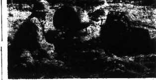
Thủy quân lục chiến Hoa Kỳ tại Đà Nẵng đã sử dụng máy radar để phát hiện các căn cứ không quân.

Hải Nội và Hải Phòng có thể bị oanh tạc không biết lúc nào trong loạt tấn công sắp tới.