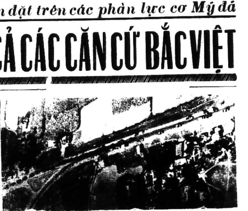
Quốc lộ 18 mà VC làm là chủ yếu từ lâu đã trở về quyền kiểm soát của quân lực VNCH. Hình trên: Đoàn công viên ở Bắc Việt đang di chuyển trên quốc lộ 18

SAIGON. — Sau đây là thông cáo của Ủy ban Taxi về việc tăng giá taxi tại Sài Gòn.