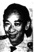
Đại tá Nguyễn Ngọc Loan và người đi chỉ huy cuộc oanh tạc của VC ở Quảng Khê

SAIGON. — Theo tin phát báo hôm 2.3, sau đây là tình hình chiến sự trong vùng này.