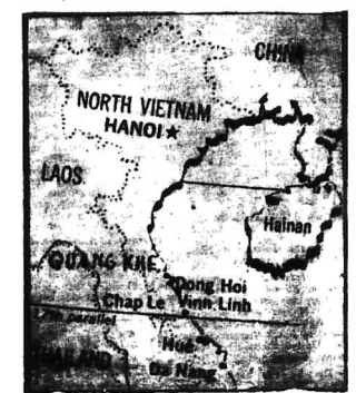
Sơ đồ những căn cứ quân sự Việt Cộng bị không quân Mỹ oanh kích chiều ngày 2.8.65

SAIGON. — Cũng một ngày (2-3.65) hai cuộc oanh tạc Bắc Việt đã được thực hiện, một bên là do không quân Việt Nam có phi cơ của không lực Hoa Kỳ gồm có máy bay B-57 và F-100 của không lực Hoa Kỳ. Sau đây là các chi tiết.