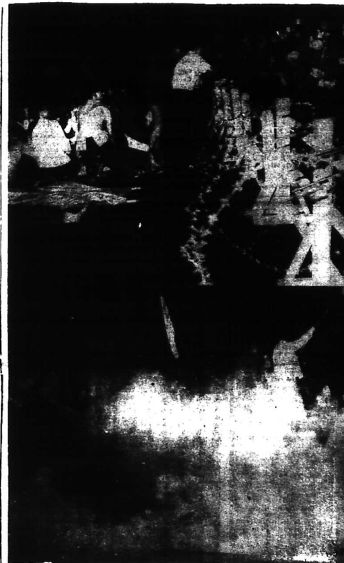
Thảm sát học sinh «quật tấn» biểu tình ngày 22-11. Dưới là tu tập và khất nguyện mà chúng là quốc kỳ của đồng bào biểu tình vẫn phấp phới giữa cơn bão lửa