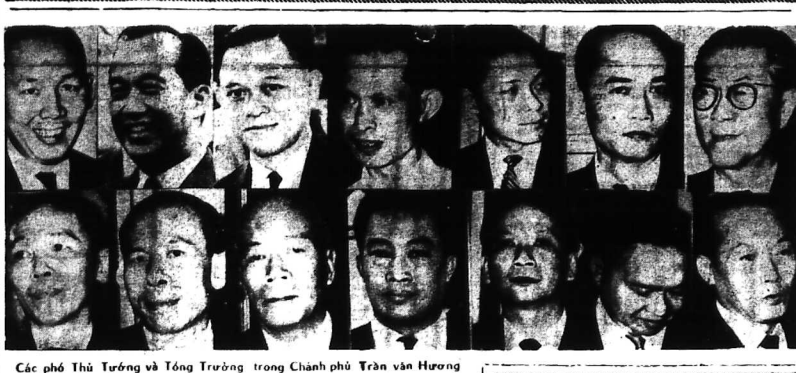
Các phó Thủ Tướng và Tổng Trưởng trong Chính phủ Trần Văn Hương