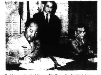
Hà 11 giờ ngày 1-11-64 tại Thủ Tướng Nguyễn Khánh đã ban hành nghị quyết Thủ Tướng Trần Văn Hương (S.X.R)