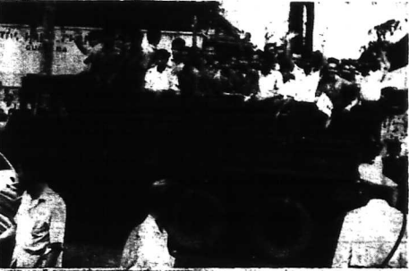
Sáng 3-11 nhiều thanh niên đã thành đã được đưa lên xe tải trưng bày huấn luyện Quân Trung để thu huấn quân sự tại hành bản phân quân địa (S.X)