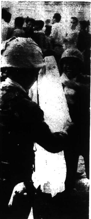
Sáng sớm ngày 3-11-88, sau cuộc tấn công thẳng vào dinh Gia Long, các chiến sĩ công nhân Đem đũa, quần áo cho nhau mặc chiếc áo dài đũi giá của... Bà Cố Văn - Ngô Đình Nhu.