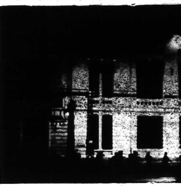
Đây là bức ảnh đặc biệt chụp lúc dinh Gia Long, thành trì cuối cùng của Đệm... Nhu, đang trong cuộc bố trí chống lại quân đội Cách mạng lúc sáng tối 1-1-63. Chúng ta thấy hình bóng những người lính - Phòng vệ Tổng Thống Phủ - lữ bộ xung quanh dinh Gia Long.