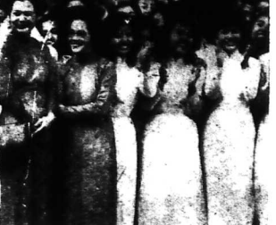
Các nữ anh Sài Gòn, đứng bên các bà mẹ, bà chị và phụ thuộc, về tay chôn đôn một đụn vi quân đội đã được kết liễu đời sống của một chế độ phản động.

Thật thật trước đó, chưa bao giờ có thế kỷ vàng này... Việt Nam chúng ta từ những năm kháng chiến và sau đến đến thế. Sự kháng cự của dân ta trước các lực lượng xâm lược... Bài thơ ca ngợi sự hy sinh và lòng dũng cảm của phụ nữ Việt Nam trong thời kỳ kháng chiến.