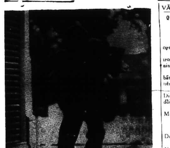
Một cảnh trên phố chính Thủ quận yêu chiến, lực chiến mạnh lướt lùa, đang lao nhanh về phía sở chỉ huy của lực lượng đột nhập có điểm này được ban chỉ huy HINH ĐƯỜI.

Cảnh nhiều người ngoại quốc đã hết sức kinh ngạc vì cảnh tượng trên