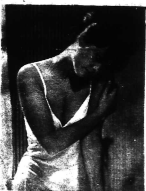
Claudia Cardinale sửa soạn đóng sen đêu cho cuốn phim mới nhất của Fellini: phim 'Souvenirs d'Amours'