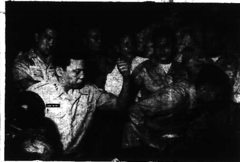
Trên ghế là: một mặt là chỉ của các Tướng tá bị trục xuất về quê nhà 13-9-64

Trước Tòa án Q.S. một trận vùng III Chiến thuật