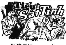
DO TỬ NHÂN (PHONG) phỏng dịch