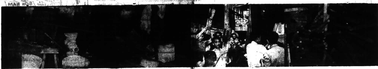
1) Lò rèn ở rên - rya và dao găm trong căn nhà ở trong Tàng thiện Vương (Xóm Cát). 2) Một số rya dêu trong nhà ở bị phát giác. 3) Đổng bảo tiếp tay đem dao găm và rya lên xe 4) 95 và khi chất trên xe. (Xem tin trong số này)