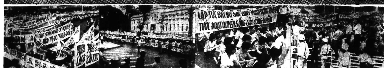
1) Đoàn người đình công biểu tình với 1 rừng biểu ngữ tại Trụ sở TĐLĐC (ra đi) 2) Đoàn người tới trước dinh Gia Long và đường (lái dẩy) 3) Một số nữ công nhân Vimtex đang ngồi trước Thủ-tướng Phủ 4) Một quang cảnh khác trước Thủ tướng phủ khi đại diện công nhân chờ được tiếp kiến.