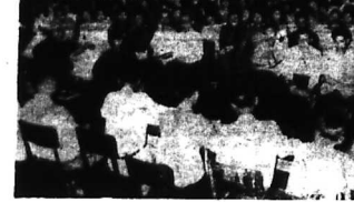
*(xem tiếp 4) Trang 4