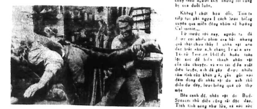
Terence Hill trong vai Chúa lười hữu dụng.

Chúa lười hữu dụng (On L'Appelle Terence Hill) cuốn phim đầu tiên mang tính chất hài hước của đạo diễn FB Clucher thực hiện qua tác phẩm của Terence Hill và Paul Spurrier. Những cảnh hành động của Terence Hill được đạo diễn FB Clucher xử lý rất tài tình. Các cảnh hành động của Terence Hill được đạo diễn FB Clucher xử lý rất tài tình. Các cảnh hành động của Terence Hill được đạo diễn FB Clucher xử lý rất tài tình.