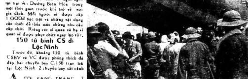
150 tù binh CS Đ. Lộc Ninh trước đó, khoảng 150 tù binh CS Đ. và VC được phóng thả tại đáp bay chuyển bay C-130 trên trại Lộc Ninh 2 chuyển bay cách đây năm 1972.