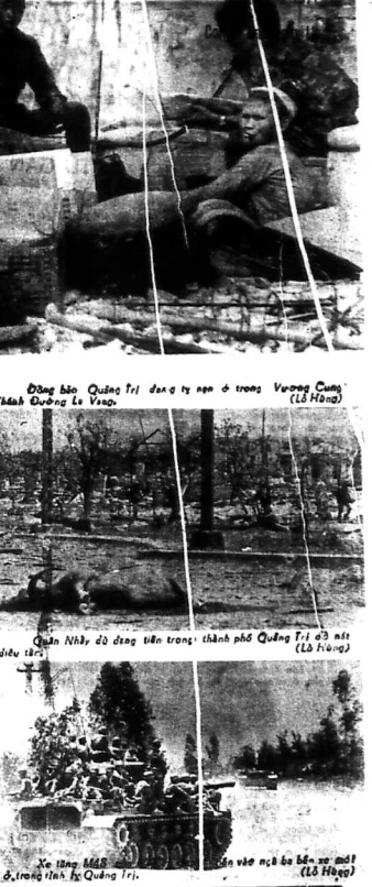
Đông đảo quân trú ẩn tại trại ở trong Vương Cung (Là Hạng) Thành Quảng Trị.

Đến Hải Lăng, chúng tôi thấy một chiếc máy bay bị bắn rớt ở Quảng Trị. Các phi công của GPMN cũng đã thả bom xuống các vị trí của BV. Hiện nay, các BV đang cố gắng giữ vững các vị trí của mình. Các phi công của GPMN cũng đã thả bom xuống các vị trí của BV. Hiện nay, các BV đang cố gắng giữ vững các vị trí của mình.