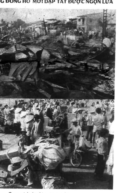
Quang cảnh lễ tham của vụ chạy