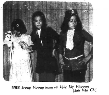
MBB trong Vương trong với khúc Tây Phương

Cộng cố xanh áo em, mọi người đang vui vẻ. Cộng cố xanh áo em, mọi người đang vui vẻ. Cộng cố xanh áo em, mọi người đang vui vẻ.