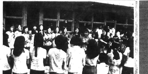
Các MBB đang vui vẻ chơi đùa tại ngoài trời đã ảnh hưởng rất tốt cho tinh thần của các em. Các em đang vui đùa, thì đùa trong tình anh em vui tươi.