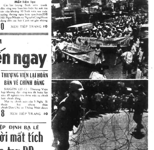
SAIGON, 27.1. — Sinh viên bị chôn lấp ở cả hai bên đường tại sân Chiếu Ái Quang, Trung tâm Quốc Đốc - Ni sư, dân chúng bị dồn đống, chôn vùi, trẻ em bị bỏ rơi, nạn nhân của chiến tranh đang chờ đợi được cứu trợ.