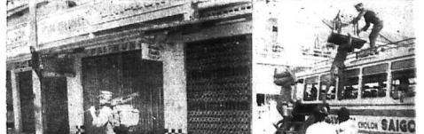
Lưu giữ 1/3 phố ở phần đông của huyện Tây Ninh. Tây Ninh chỉ còn lại các hàng quán ở các đầu phố. Hàng quán chỉ còn lại ở các đầu phố. Hàng quán chỉ còn lại ở các đầu phố.