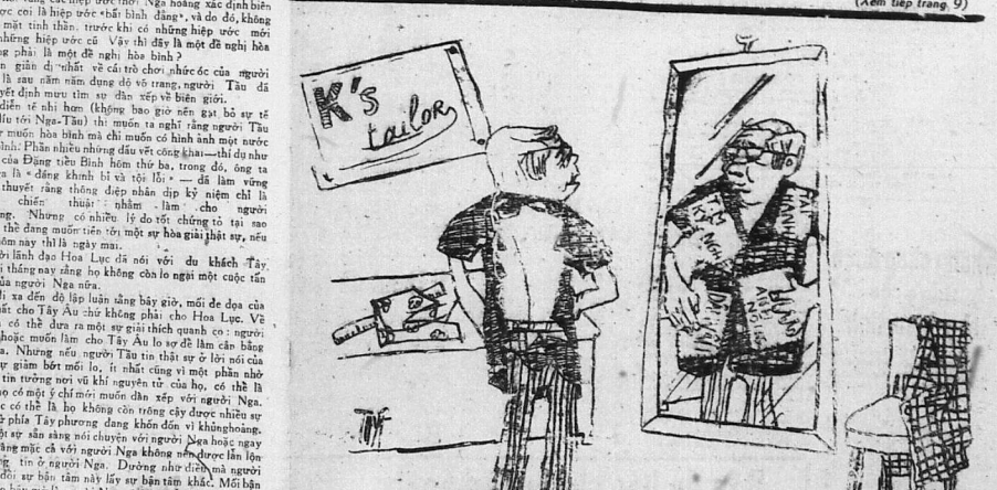
(Xem tiếp trang 9)