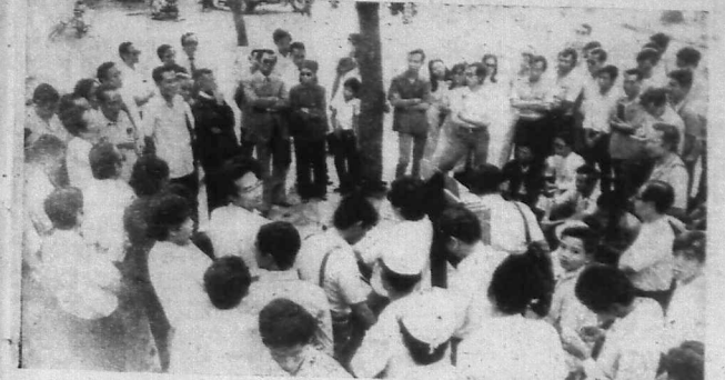
Cuộc họp diễn ra dưới góc cây bên lề đường, vì trời mưa quá to, người dân không thể đi ra ngoài được.

LIÊN HIỆP QUỐC, 25-11 (UPI) - Liên Hiệp Quốc đã thông báo về cái chết của U Thant.