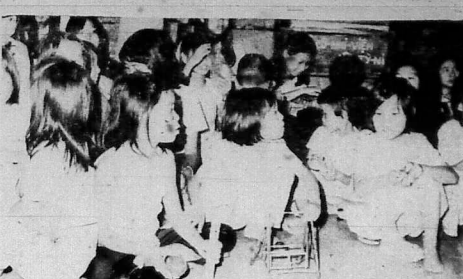
Bính cay... Các cô nàng vui vẻ... MBB AO TRĂNG