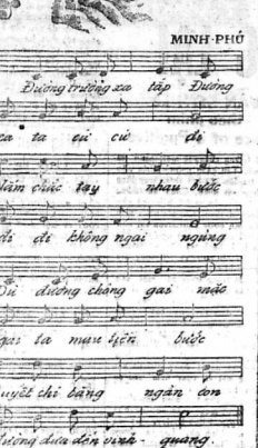
Đường trường xa báo Đường xa xa cuối của đời Năm chiếc tay nhau bước đi để không ngại nắng Đường trường xa xa cuối của đời Năm chiếc tay nhau bước đi để không ngại nắng Đường trường xa xa cuối của đời Năm chiếc tay nhau bước đi để không ngại nắng