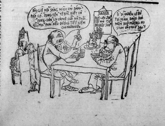
Đầu tiên phải có sự đồng lòng và hợp tác của tất cả các bên liên quan.