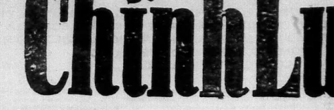
CHU NHẬN, KIỂM CHỨ BỐT ĐỎ-NAM-VANG-SUNG 82, LÊ-LAI SAIGON - Đ.T. 29.244

Đây là một nguyên tắc công lý... những người khác nghĩ... cho thì hành xử... có thể đạt được bằng một... vụ án... được giải quyết... nhất là vụ án của dân... tên quân Duy Xuyên.