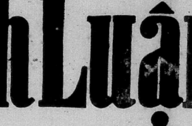
CÓ THƯ KÍ TÒA ĐOÀN SANG 11 TỰ-CHUNG

SAIGON, 19-6 (UPI) - Các nhân viên quân sự cấp cao của MiG-19 của CSBV, đã được nhìn thấy trên một chuyến bay từ Bắc Bay vào chỗ không phải từ các sân bay CS mới lập tại Miền Nam.