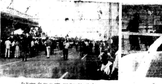
Xả lỵ vọng dài từ thu đi giảm giao thông thêm tiêu lợi

Chỉ một vài tuần trước đây, các trại tù binh ở VN đã được thả ra. Nhưng có một đạo quân khác với tầm chỉ ở độ về với địch, để thường với đạo, 45 lượt với lực lượng của chỉ gần 40.000 người cũng đã đi một mình khi phải mở trong tâm khảm người Việt Nam. Bất dầu có một hàng một số bất si, nhân viên về thực vụ trong một bệnh viện ngoại khoa lưu động vào 9.1964, Đại Hàn dân quốc thực sự đã rút hết vào 15-3.1972 theo đơn Hiệp định ngưng bắn và tại lực lượng binh sĩ VN.