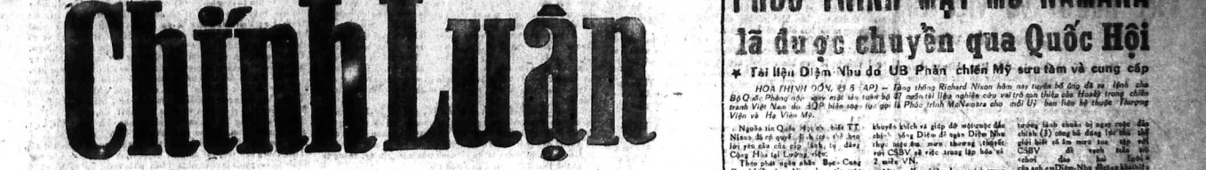
CNH NHM KIEM CHU-DU: BANG VAN-SUNG - 82, LELAI SAIGON - ĐT. 23.244 O CS THU KY TON-SON sống lập - TÔ-CHUNG

Năm Thứ 8 - Số 2.189 - Thứ Sáu 25-6-1971 (Ngày 3 Tháng 5 Nhuận Năm Tân Hợi)