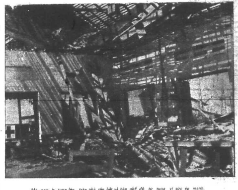
Một người bị thương, trên nắp nắp hè và bàn ghế đổ tung tóe ở sự cố thảm.