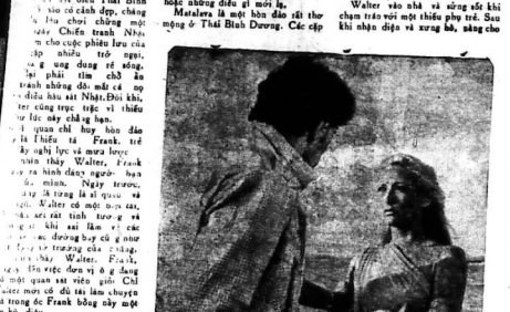
CATHERINE NHÌN WALTER ĐANG MỒI CẤP MÁT CHÂN CHỢA YÊU THƯƠNG