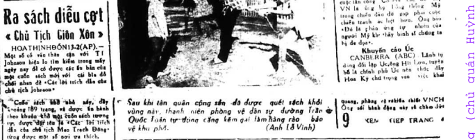
Sau khi tàn quân công sản đã được quét sạch khỏi vùng nam thành phố về đôn tự đường Tân và Quốc lộ 19, quân công sản đang cố gắng tìm cách vượt sông Hương về phía bắc.

HOA THINH ĐÓN (14/2/AP) - THƯỢNG NGUYỄN ĐỖ (14/2/AP) Về phía các binh lính (10.500 quân) đang chờ đợi tại Huế, họ đang chờ đợi để tiếp cận Huế.