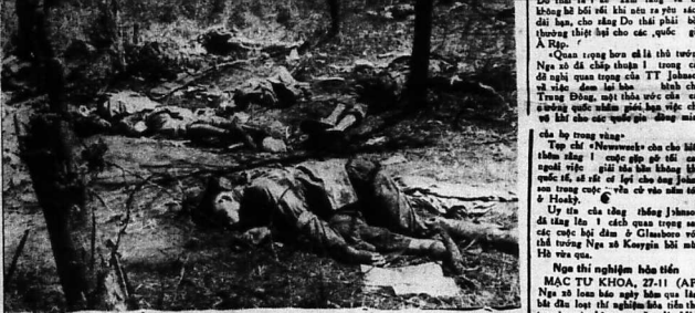
Công quân phục kích ở bãi mìn Đôn Phước Lộc (LVAX)

NÓU ƯỚC 26-11 (AP). - Tập đoàn Newscrowd hôm nay chọn cho họ TT Hoảng Johnson đặng dự lễ khai mạc tại Hội nghị Thương Đình giữa 2 đại cường vào mùa Xuân 1968.