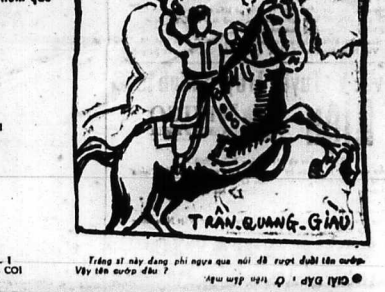
Tranh đố vui

Giải đố chữ hươu 1) AN 2) CHA 3) O A 4) N N 5) GAC 6) B - N B 7) B - H O 8) ANN - C 9) BAIH - C 10) THANH - NO 11) THANH - GI 12) HANG - IN 13) N - H 14) UI