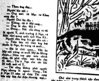
Tranh đồ vật... Một chú ngựa thồ đang đi...