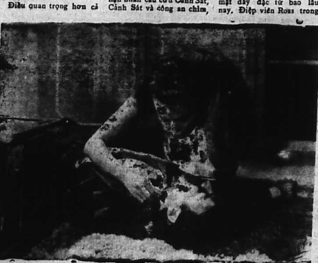
Jasmine sống về trước cái chết đột ngột của chàng thanh niên họ...