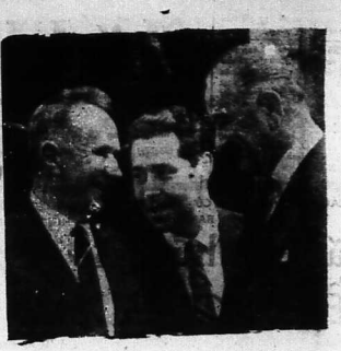
Cũng như Kít xi gin - Giôn xon 1967 tại Glassboro

—Tôi tin rằng nếu chúng ta giải quyết... (Text discusses the political situation in the USSR.)