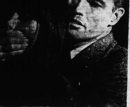
Kell bị miệng Esther vì nàng suýt vì tên làm bại lố là học

cho một tiếng các thầy thuốc thì bình My vào một lúc để anh gác. Keil tìm kiếm người bạn một lúc để anh gác. Keil tìm kiếm người bạn một lúc để anh gác.