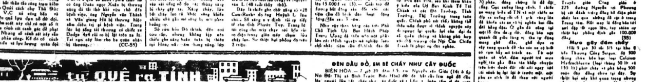
ĐIỀU KIỆN SỐNG. Ông nói: "ĐIỀU KIỆN SỐNG".