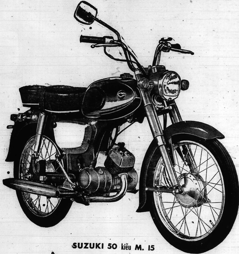
SUZUKI 50 kiểu M. 15

Quý vị đi làm công việc mau hơn nếu dùng SUZUKI kiểu M. 15