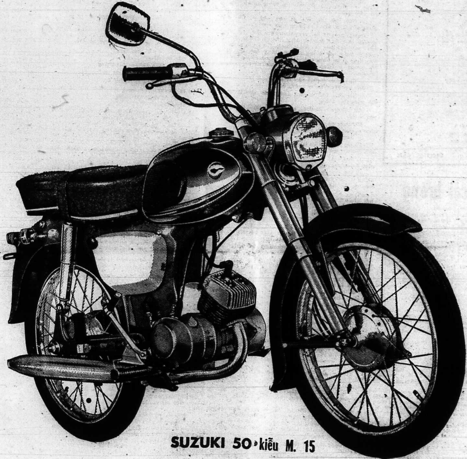
SUZUKI 50 • kiểu M. 15

Quý vị đi làm công việc mau hơn nếu dùng SUZUKI kiểu M. 15