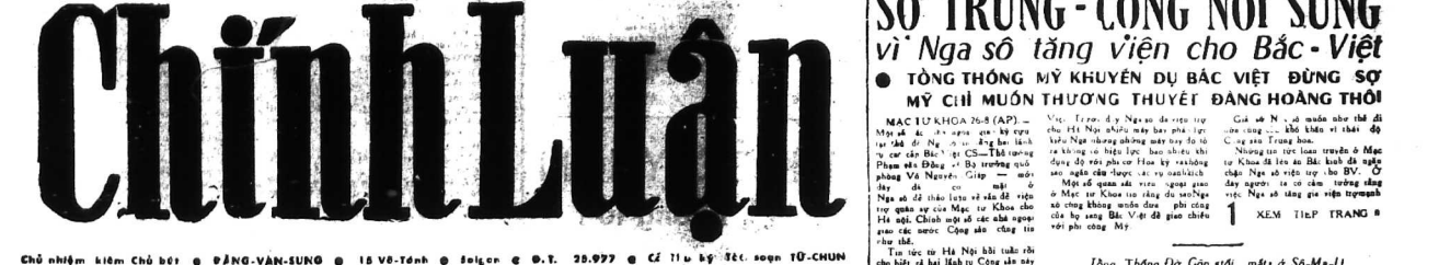
Chủ nhiệm kiêm chủ tịch ○ ĐẶNG-VĂN-SUN ○ IS VÔ-TINH ○ BẮC-KH ○ Đ. T. 28.977 ○ CẾ TIU KỸ SÉT. NGON TỬ-CHUN

Năm thứ 5 Số 7228 Trang 5 Đồng CHỦ NHẬT, THỨ HAI 28, 29-8-1966 (Ngày 13, 14 Tháng 7 Bình Ngô)