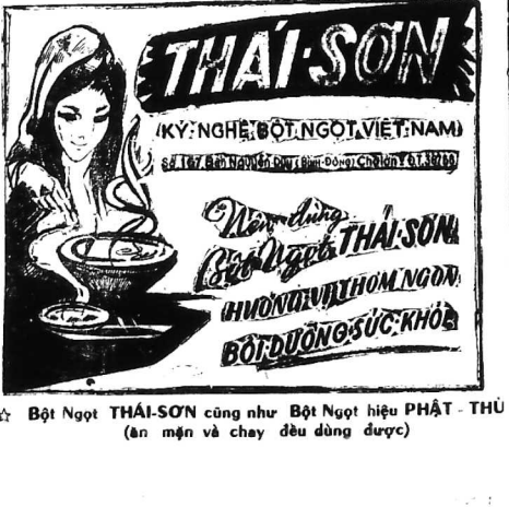
BỘT NGỌT THAI-SON cũng như BỘT NGỌT HIỆU PHẬT - THỤ (ăn mặn và chay đều dùng được)

ĐẠI DIỆN TÀI VIỆT NAM UNIVERSAL TRADE AGENCY