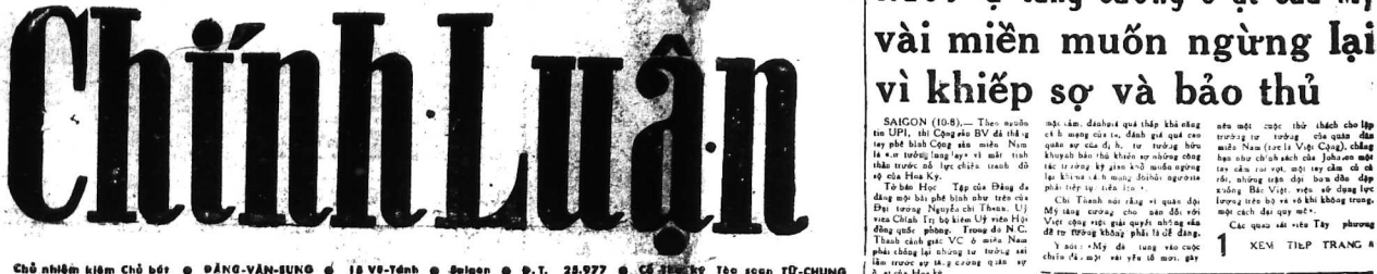
Chủ nhiệm kiêm chủ bút • ĐẶNG-VĂN-SUNG • 18 Võ-tánh • Saigon • Đ.T. 29.977 • CS BẢO AN QUỐC GIA • Ủy Tào soạn TỰ-CHUNG

Năm thứ 3 • Số 707 • 8 Trang 5 Đồng THỨ NĂM 11-8-1966 (Ngày Tháng 6 Bình Ngo)