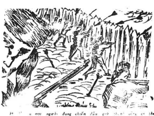
Đáp án: ...